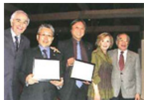
右：写真2 サーティフィケート 授与式