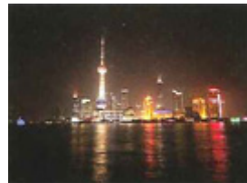
右：写真2 上海の夜景