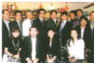
写真1 両委員会合同／演者懇親会

今年度は、したがって後半に第2回から第4回のセミナーが集中して開催される。まず1月27日に「ふり返ってみよう！きれいな歯と、きれいな歯肉を」と題して第2回を仙台（ホテル仙台プラザ）で開催する。また3月2日に札幌（北海道 歯科医師会館）、3月16日に名古屋（愛知学院大学楠元手キャンパス）で各々開催する。皆様のセミナー参加、ご支援をお願いします。