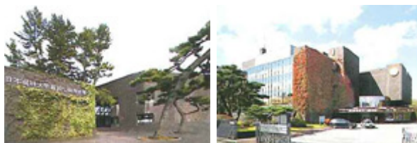
(左：写真1 新潟生命歯学部講堂、右：写真2 日本歯科大学新潟生命歯学部)

最新の内容のプログラム(学術・臨床)と酒・肴およびエンタテインメントを準備してお待ちしています。家族、友人とお出かけ下さい！