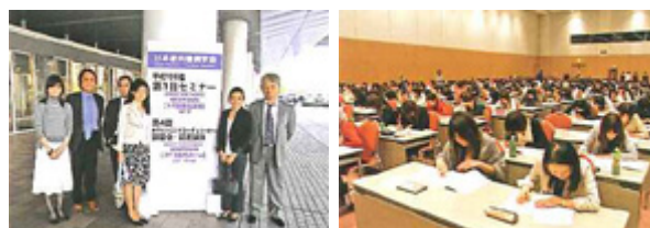
（左：写真1 講習会会場前にて、右：写真2 認定試験の実施）

前回の認定試験までで、すでに1,347名のWCが誕生しています。来年度も全国で4回の開催が予定されていますので、このペースで行けば来年度中には4,000名を超える勢いです。この間、本学会に入会した歯科衛生士の数も400名を超え、今後も衛生士の会員数は増え続けると思われます。昨今不況が伝えられる歯科業界の中で、今歯科衛生士が一番熱いかもしれません。