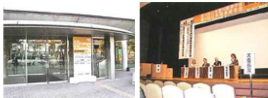
(左：写真1 百年講堂、右：写真2 シンポジウム)

最後になりましたが、皆様方のご健康、ならびに一層のご活躍を祈念申し上げ、御礼と御報告とさせていただきます。